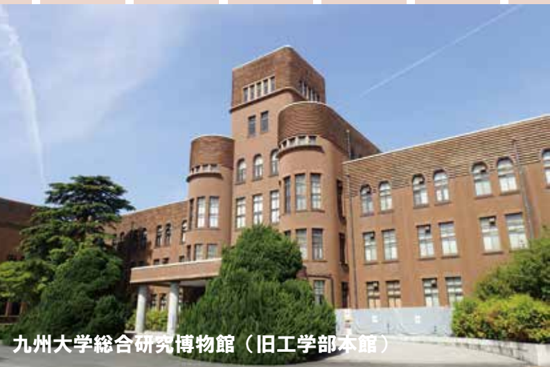
九州大学総合研究博物館 (旧工学部本館)

※新型コロナウイルス感染症の状況などにより、中止になる場合もありますのでご了承ください。