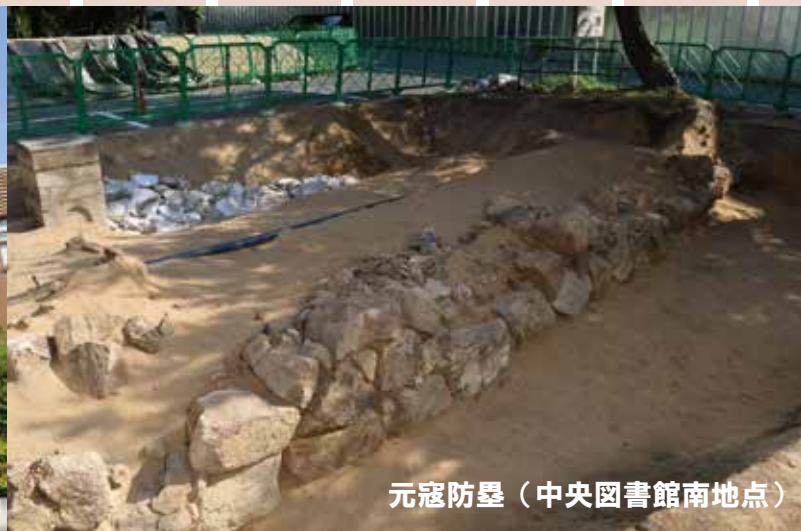
元寇防塁 (中央図書館南地点)