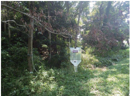
池の周辺に設置したUV-LED ライトトラップ