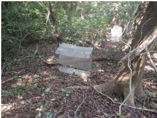
森林内に設置した地表式FIT(丸山式FIT)