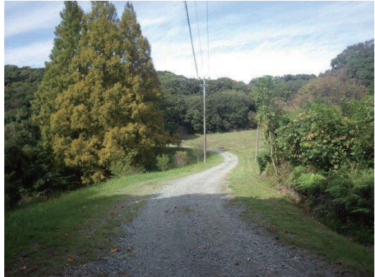
演習林内の作業道