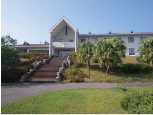
福岡演習林事務棟