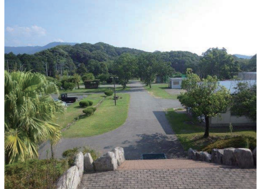
事務棟から南を望む(中央の山までが敷地)