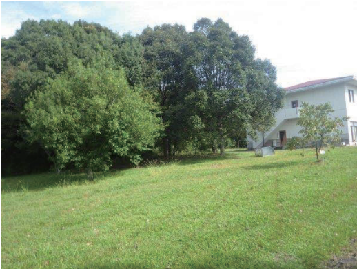
事務棟西のカシ類の見本林