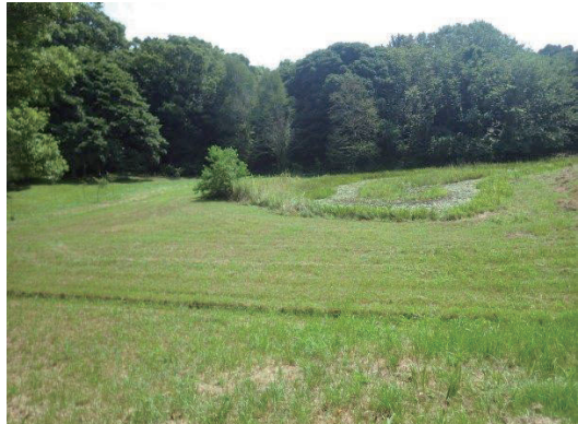
草原の中の池(手前斜め横にU字溝が見える)