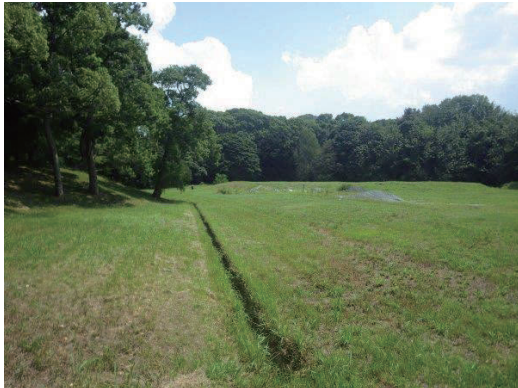
草原の中のU字溝(草刈りの直後)